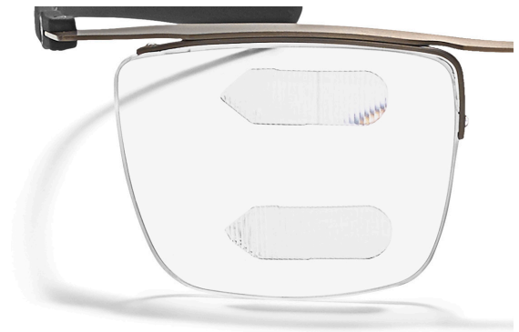
ML Peli Prism Press-On segment

Vi tillhandahåller utförliga utprovninginstruktioner tillsammans med vårt testset.