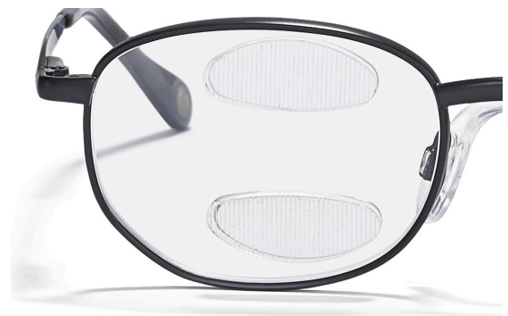
ML Peli Prism PeliSeg double