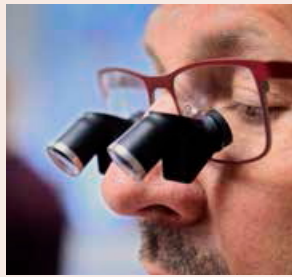
ERGONOMI. Patenterade luppglasögon, vinklade med periskopeffekt, för att minska förslitningsskador hos bland annat kirurger.